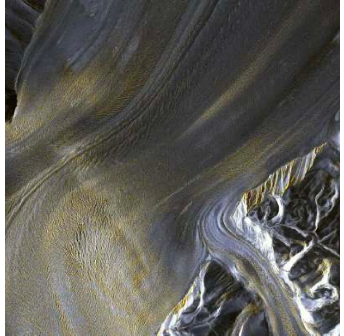
Nimrod Glacier, Antarctic

redundant naar twee verschillende tape-technologieën en -locaties gearchiveerd, om zo het risico van dataverlies te minimaliseren. Tot op heden is naast de LTO6/7-tapesystemen de evenwel op tape gebaseerde oplossing van Oracle StoraTek STK T10000 gebruikt. Deze wordt echter niet meer verder ontwikkeld. “Wij zien al langer een verandering in de markt. Bij tapes is het aantal van verschillende drive-fabrikanten de afgelopen jaren alleen maar afgenomen, zodat een dual-vendor-strategie, die in de langetermijnarchivering gebruikelijk is, niet meer vol te houden is.”, legt IT-Manager Stephan Schropp uit. “Voor bepaalde data van de actuele missies moet tevens een lage wachttijd bij het lezen van de data bereikt worden.” Nieuwe soorten van virtual tape libraries kunnen de oplossing voor de transitie naar nieuwe archiefmedia zijn.