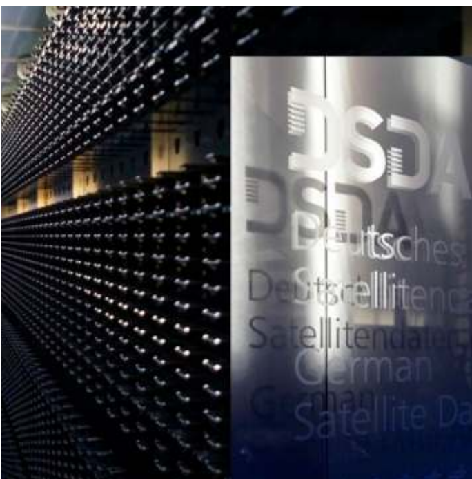
Tape Library, German Satellite Data Archive (D-SDA), DLR

De satellieten zijn voor zeven jaar gebruik gepland, gedurende welke ze de aarde omcirkelen. Gedurende deze tijd – en soms ook een paar jaar langer – verzamelen ze hun data en sturen deze regelmatig naar het S-DSA. De archivering van deze satellietdata moet voor en zo lang mogelijke periode zijn om ook voor toekomstige uitdagingen de analyse van historische data mogelijk te maken. Het datamanagement wordt met een eigen ontwikkelde software gedaan. De data worden eerst op een harddisk-cache opgeslagen en vervolgens