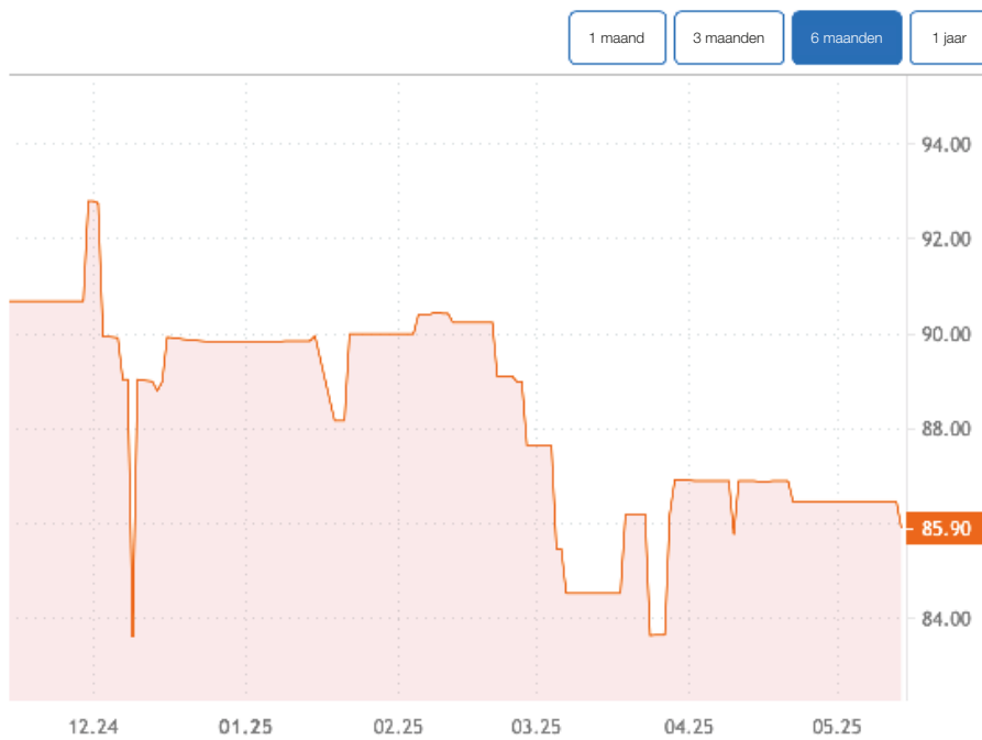
sinds mei 2025